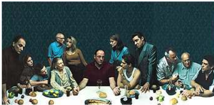
Leibowitz, Annie . La última cena. Los Soprano

Cuando el cristianismo se erigió en la religión preponderante en Europa, la pintura pautó diversas estampas obligadas. La Virgen maría con el niño, la creación, la crucifixión de Cristo... La última cena fue la más popular, sobre todo a partir del momento en el que en las casas empezaron a colgar cuadros con reproducciones. De niño me fascinaban los comedores de algunos de mis amigos, que tenían en la pared una representación de la última cena, presidiendo la mesa en la que la familia comía. No era una redundancia visual, pero había ahí algo -¡la santa cena presidiendo la cena cotidiana de la gente!- que me resultaba hilarante.